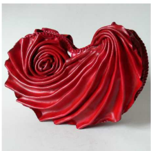
Katharina Müller Bilder