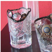
Rainer Braun Porzellan